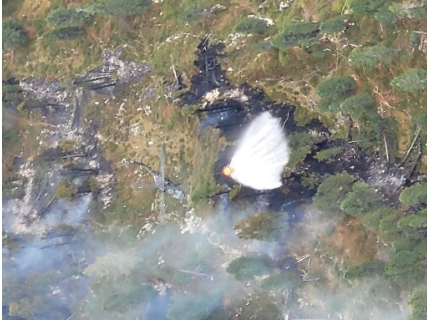
Einsatz Bundesheer zu Waldbrand